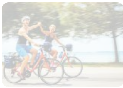
Alcuni cicloturisti in vacanza con Girolibero

danza classica. Così si progettano al meglio vacanze sostenibili e nuovi modi di viaggiare. Mentre le ciclabili più belle d'Europa o visitare una capitale in sella sono ormai una passione consolidata per i cicloturisti, emergono nuovi trend come la richiesta sempre maggiore di e-bike, che permette a tutti di avvicinarsi a questa vacanza, e la formula "bici e barca". Di giorno sui pedali, la sera una suggestiva barca-hotel, con 10/12 cabine, dove cenare e pernottare: Provenza, Olanda, Croazia ma anche Italia sono le mete preferite per questo tipo di vacanza. Numeri alla mano, chi la prova una volta non può più farne a meno. La ricetta del successo, che li ha portati