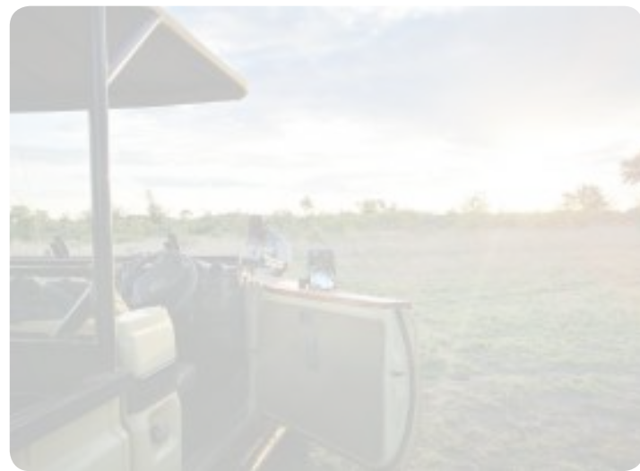
Il nostro mestiere è il vostro appassionante viaggio. Africa Madikwe Game Reserve (Sud Africa)

Il tour operator? Un professionista che progetti esperienze per i viaggiatori. Al contrario, a volte, i possibili volumi e le opportunità economiche pilotano l'interesse del momento, incurante delle ricadute in termini di sfruttamento delle risorse. Così non è per noi. Ci siamo dati un nome impegnativo, Ubuntu, per indicare attenzione agli altri che siano i nostri viaggiatori, i fornitori ed il nostro personale: un buon lavoro è una responsabilità, è etica professionale. Ci siamo dati il compito di essere un ufficio di produzione in costante vetrina nel sito web. Studio e ricerca, contenuti prima che itinerari, per qualsiasi destinazione proposta. Itinerari a tema, un'informazione costante, un passaparola tra i viaggiatori, per elaborare la proposta sulla base delle esigenze di quanti si affidano a noi. Personale esperto che collabora con professionisti del turismo, siano agenzie di viaggio, fornitori, partner, collaboratori. Nel team Ubuntu si sono riuniti percorsi di amanti dei viaggi, prima ancora che operatori, con esperienze di due generazioni e che realizzano itinerari in terre e luoghi direttamente conosciuti, vissuti ed amati. Le destinazioni diventano itinerari: archeologici, dei sapori, del benessere ed anche del lusso, inteso nel significato di destinazioni poco conosciute, poco frequentate. Destinazioni dove concedersi servizi di guide esperte, siti di interesse peculiare per un viaggio sempre con-