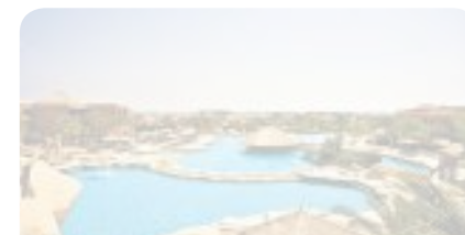
Futura Club Laguna Vista - Sharm El Sheikh

Tra le novità 2019 si evidenzia il Mar Rosso, inserito nell'offerta per soddisfare le richieste provenienti dal mercato italiano desideroso di tornare in Egitto, meta unica per la bellezza del mare, la fruibilità in ogni stagione, la vicinanza all'Italia e la ricchezza del patrimonio storico-culturale. Il t.o. propone il Futura Club Brayka Bay in uno dei tratti più belli della costa di Marsa Alam e il Futura Club Laguna Vista a Sharm El Sheikh, in un'area protetta dal 1992 di Nabq Bay. Entrambi i villaggi offrono un punto mare spettacolare e fondali di sabbia dolcemente digradante che permettono un comodo accesso in acqua, particolarmente indicato per famiglie. Novità anche in Grecia con il Fu-